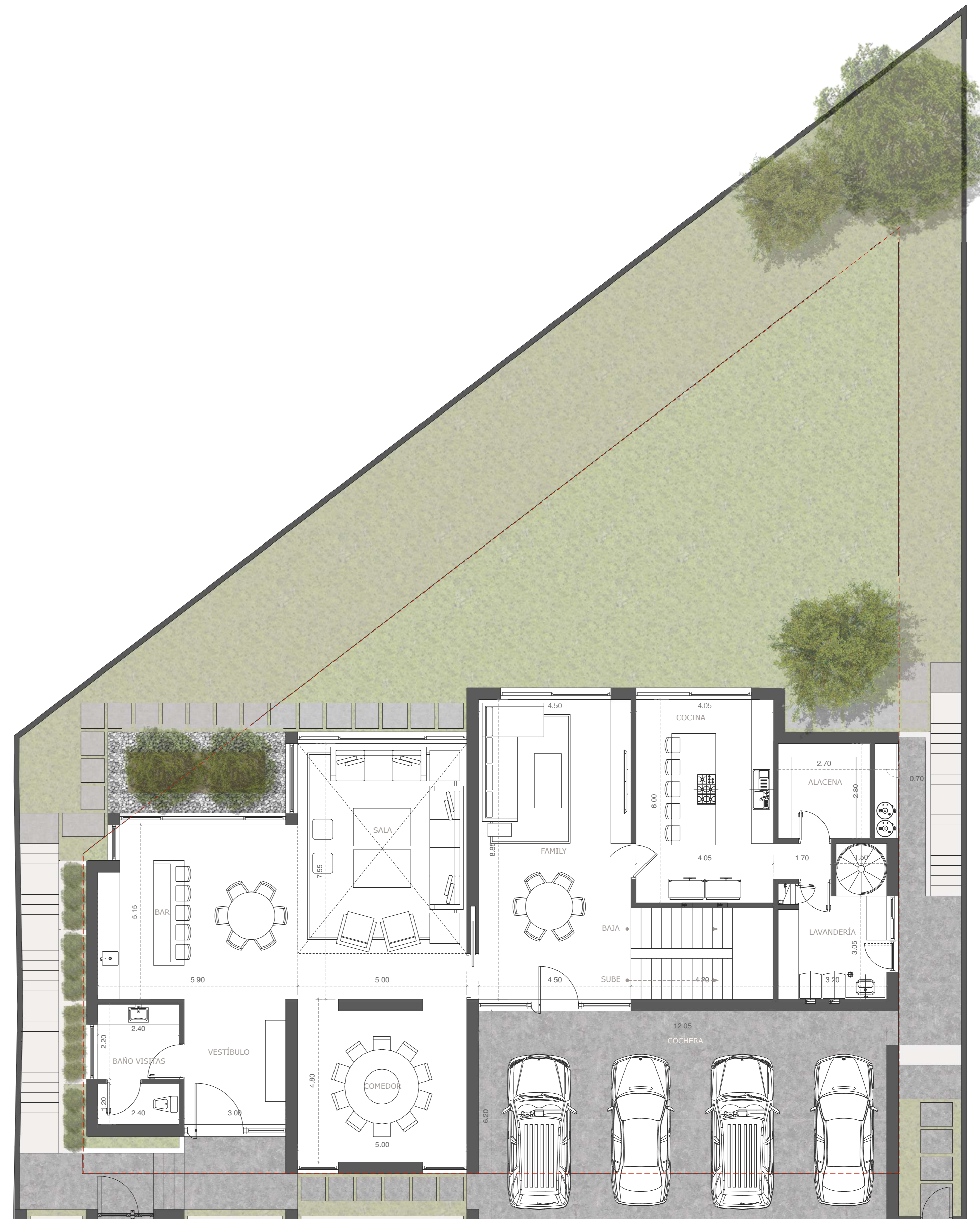
PLANTA BAJA | 01 PROYECTO ARQUITECTÓNICO ESCALA 1:75