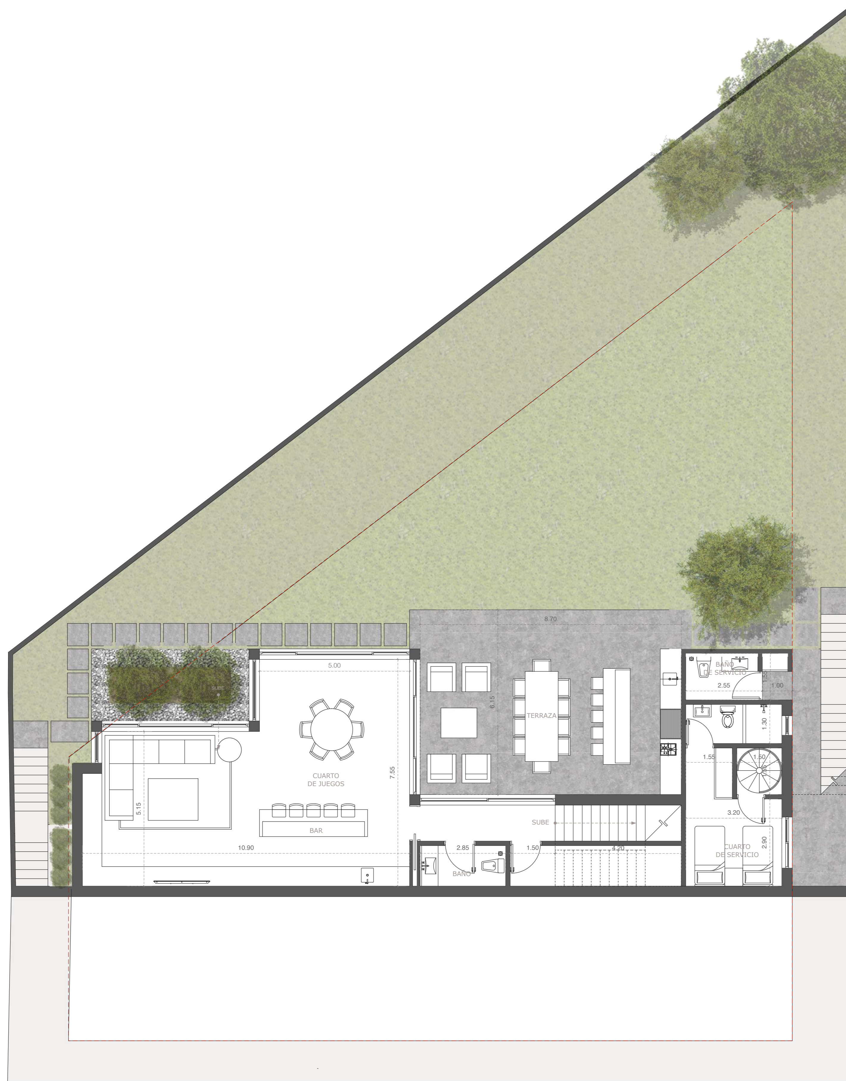
SÓTANO | 00 PROYECTO ARQUITECTÓNICO ESCALA 1:75